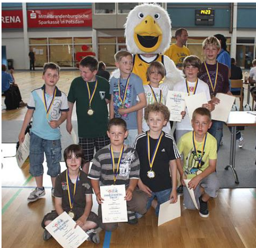
Text: M. Knopf